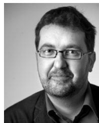
WOUTER VAN BESIE Voorzitter Groen!

Dit programma bevat op sommige punten voorstellen die niet tot de federale bevoegdheidsdomeinen behoren. We voegden ze toe om tot een coherent pakket van oplossingen te komen. Op de meeste plaatsen geven we in de tekst expliciet aan waar dit het geval is.